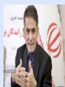
همایون صادقی بازرگانی استاد تمام اپیدمیولوژی رئیس مرکز تحقیقات